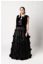
Tenue haute couture « Inuvialuk at the Met Gala »