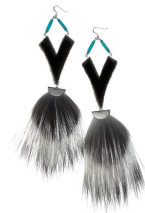
Boucles d'oreilles Signature en peau de phoque et en renard.