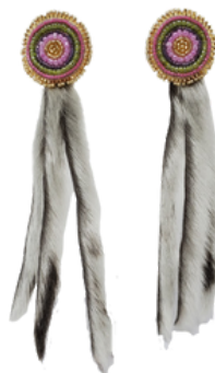
Boucles d'oreilles en peau de phoque