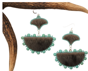
Boucles d'oreilles Ulu en peau de phoque