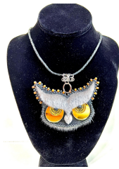
Pendentif hibou en peau de phoque