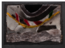
Tapisseries en peau de phoque