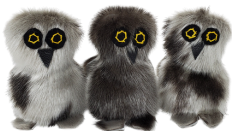
Ukpiit en peau de phoque