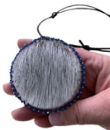
Pendentifs en peau de phoque