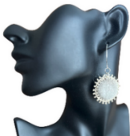
Boucles d'oreilles Moonbeams and Dreams