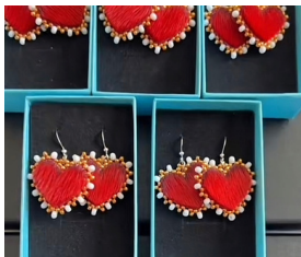
Boucles d'oreilles « Mini Love » cœurs en peau de phoque