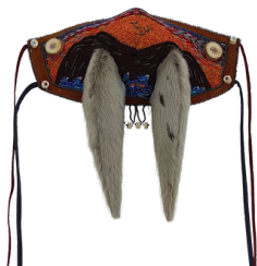
Masque de pandémie «Bounty of Our Land »