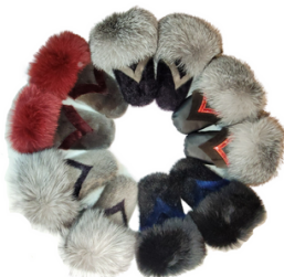
Mitaines en peau de phoque