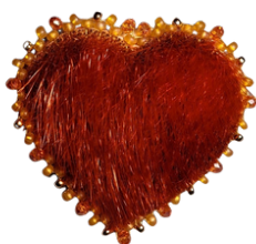
Épingle de solidarité en coeur en peau de phoque orange