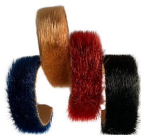
Bracelets en peau de phoque