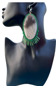
Boucles d'oreilles en peau de phoque