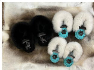
Pantoufles en peau de phoque et fourrure de renard