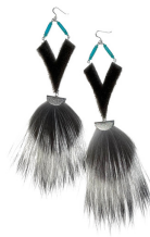
Boucles d'oreilles Signature en peau de phoque et en renard