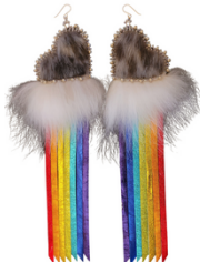
Boucles d'oreilles en coeur en peau de phoque avec franges arc-en-ciel