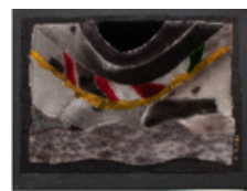
Tapisseries en peau de phoque