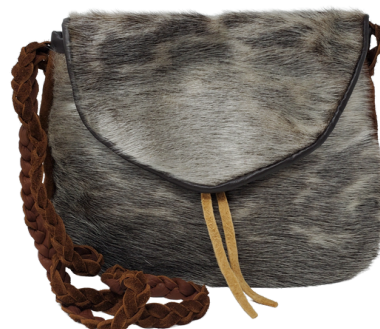
Sac à main en peau de phoque