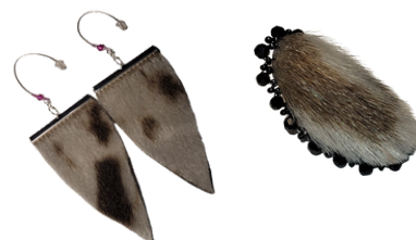
Boucles d'oreilles et bagues en peau de phoque