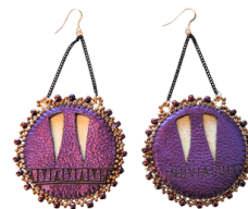
Boucles d'oreilles en peau de phoque en défense de morse découpées au laser