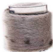
Bracelet manchette en peau de phoque