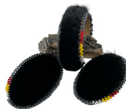
Manchette et boucles d'oreilles en peau de phoque