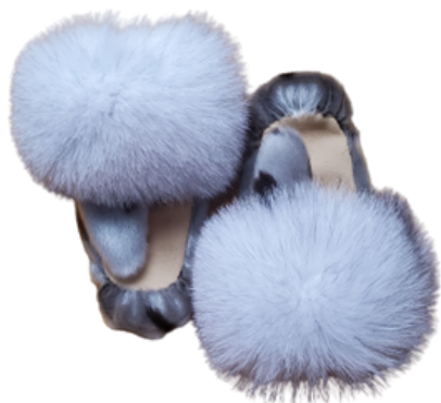
Mitaines en peau de phoque