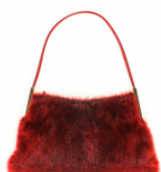
Sac à main en peau de phoque