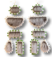
Boucles d'oreilles Inukshuk en peau de phoque