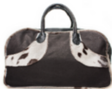
Sacs de transport en peau de phoque et de bison