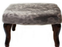
Repose-pieds vintage en peau de phoque