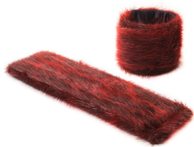
Bracelet manchette à bandes en peau de phoque